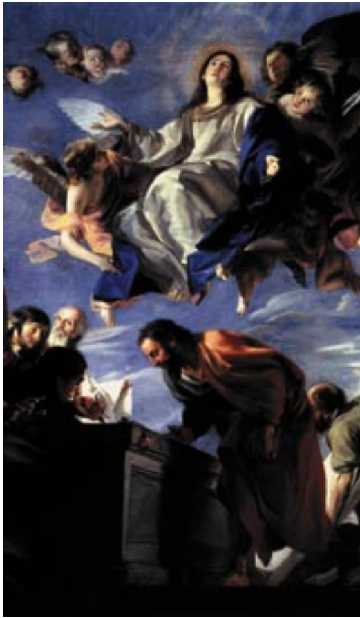
Juan Martin Cabezalero, Assunzione della Vergine , Museo del Prado, Madrid

1. il contenuto dei due dogmi (compreso all'interno del dato biblico dell'economia della speranza e della grazia) può dirsi consonante con il dato biblico e l'antica tradizione comune (cfr. § 78).