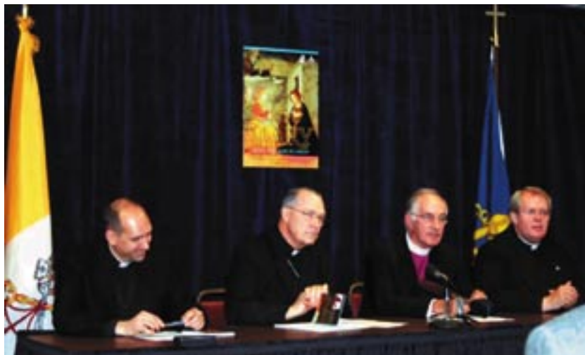
La commissione cattolico-anglicana presenta il documento

Come è affermato al I paragrafo del documento, sono stati i leader delle due chiese a chiedere alla commissione bilaterale di affrontare l'argomento mariano, dopo quelli sulla Chiesa, l'autorità, l'Eucarestia e la morale. Il motivo è semplice: la Madre del Signore, pur avendo un posto importante in seno alla Comunione anglicana e alla Chiesa cattolica, è motivo di divergenze teologiche e spirituali tra le due comunità.